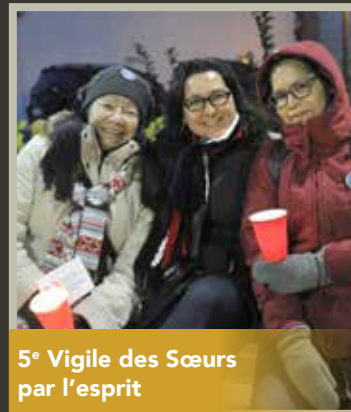
5 e Vigile des Sœurs par l'esprit

Un soin particulier est porté à développer des projets visant à améliorer le sort des femmes et des filles autochtones. L'accompagnement individuel et de groupe, les activités d'artisanat et les projets artistiques, les rencontres d'échanges et de partage et l'implication des partenaires tels Assaut Sexuel Secours ou la maison Le Nid sont quelques-uns des moyens mis de l'avant.